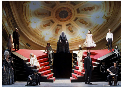
Scenă din actul III