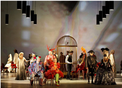
Scenă din actul II