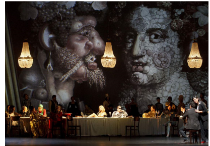
Scenă din actul IV